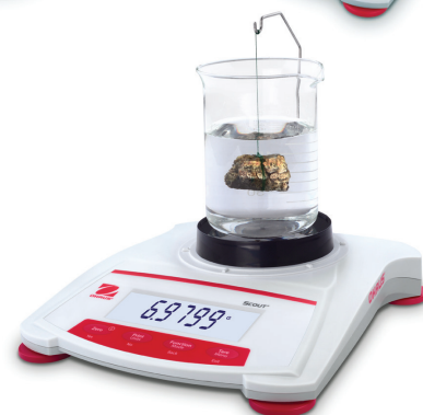
Scout illustrée avec le kit de détermination de densité en option